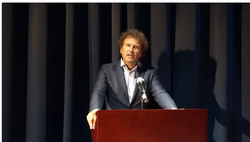
Toespraak Privacy First voorzitter Bas Filippini vanuit geheime locatie nabij Malieveld (Den Haag), 21 juni 2020.