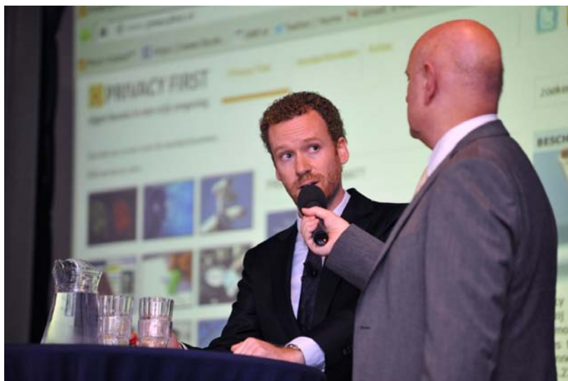
Interview met Privacy First tijdens jaarlijkse Wapendag van de Koninklijke Marechaussee (25 oktober 2013, Apeldoorn)

ander buitenlands evenement van formaat waar Privacy First zelf op het podium stond waren de Belgische Big Brother Awards. Daarnaast gaf Privacy First in 2013 onder meer gastcolleges en presentaties bij de Vrije Universiteit (Amsterdam), Hogeschool Utrecht, Hogeschool Rotterdam, Universiteit Utrecht, Hogeschool van Amsterdam, Universiteit Leiden en, last but not least , de Koninklijke Marechaussee.