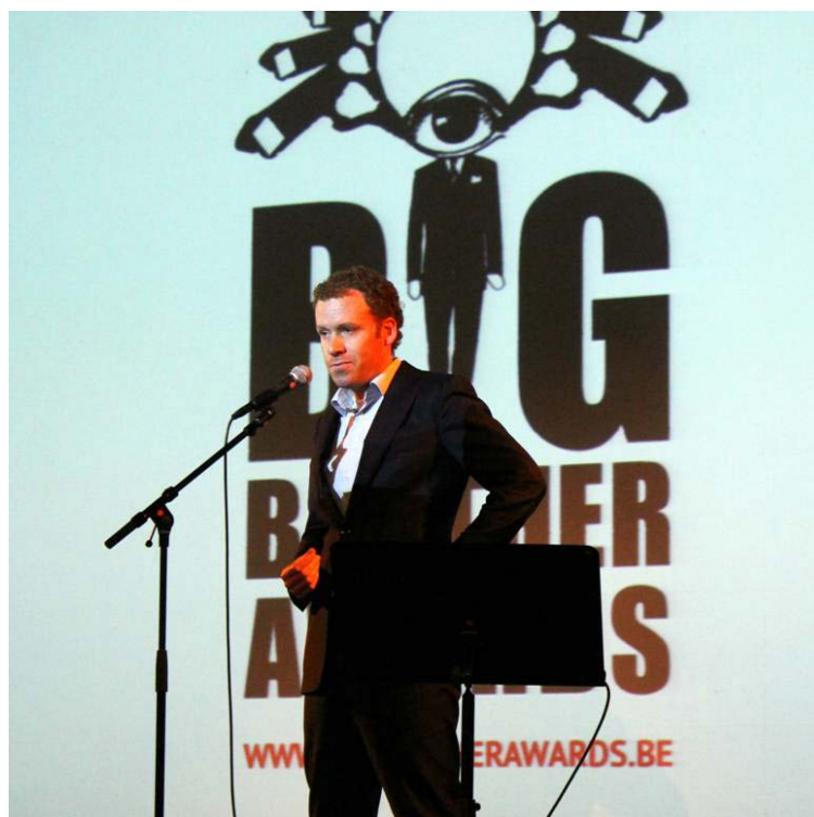
Toespraak Privacy First bij de Belgische Big Brother Awards (30 mei 2013, Gent)