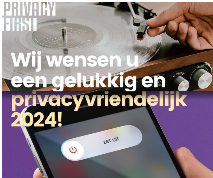
Nieuwjaarswens Privacy First

De website van Privacy First https://www.privacyfirst.nl vormt ons primaire nieuws- en opiniekanaal. Begin 2023 is onze website geheel vernieuwd en heeft Privacy First tevens een nieuwe huisstijl en logo. Onze voormalige Engelstalige website https://www.privacyfirst.eu is hierin geïntegreerd, evenals onze website https://privacyawards.nl (Nederlandse Privacy Awards) en ons project PrivacyWijzer (over het Internet of Things). Daarnaast beheert Privacy First onze campagne-websites https://specifieketoestemming.nl (medische privacy) en https://psd2meniet.nl (PSD2). De websites van Privacy First werden de laatste jaren deels gesponsord door de privacyvriendelijke provider Greenhost. Op social media is Privacy First van oudsher voornamelijk actief op Twitter (nu X) en LinkedIn , ook met een eigen LinkedIn-groep voor privacy-professionals. Daarnaast vindt u ons bij het privacyvriendelijke platform Quodari . Zowel onze Twitter- als onze LinkedIn-aanhang groeien al jaren gestaag. Wilt u graag op de hoogte blijven van alle ontwikkelingen rondom Privacy First? Meldt u dan aan voor onze nieuwsbrieven via www.privacyfirst.nl !