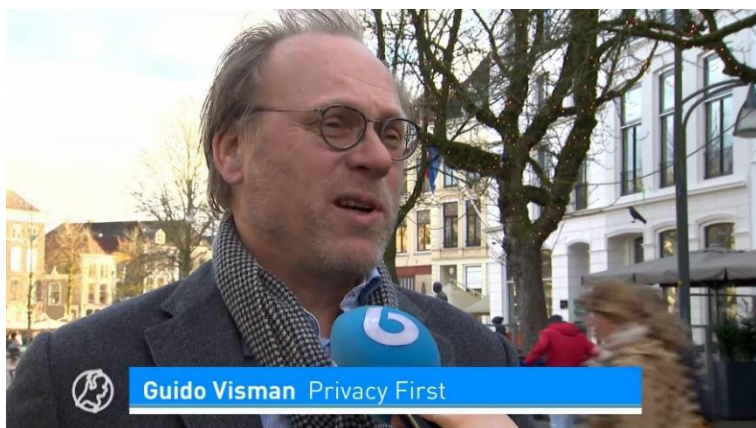
Interview met Guido Visman (bestuurslid Privacy First) bij Hart van Nederland, 25 maart 2023.